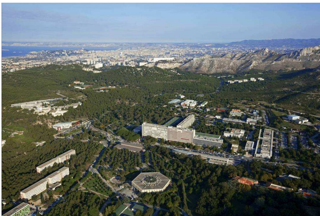
Vue aérienne du Campus de Luminy

► Le Campus Aix-Marseille Université contribue de façon décisive à la création d'une « Capitale du Savoir du Sud de l'Europe » tourné vers l'espace euroméditerranéen.