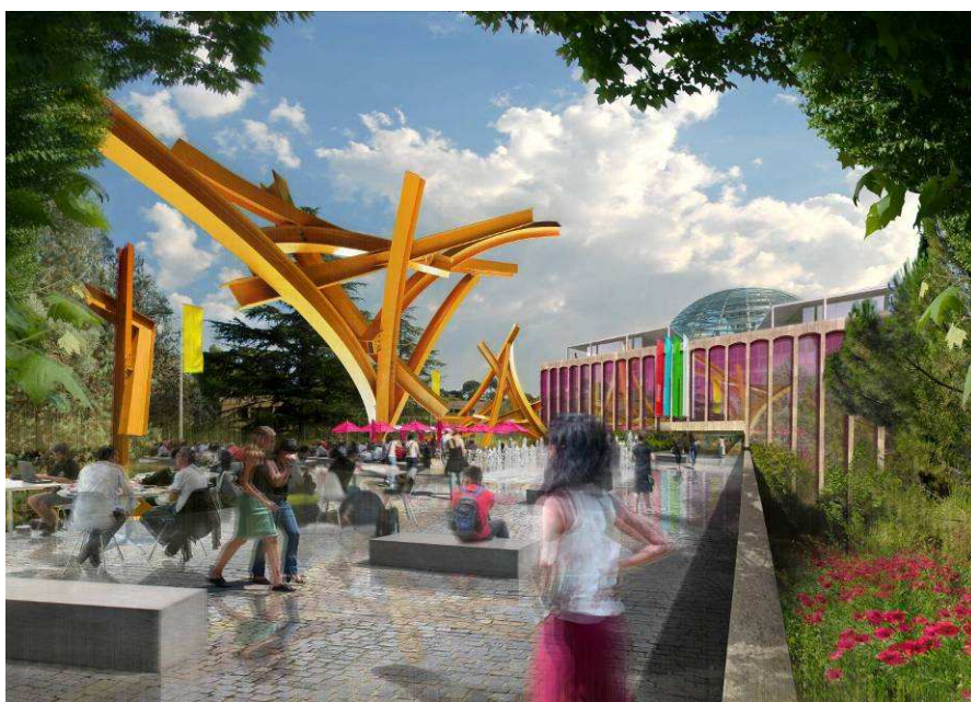
Nouveau cœur de Campus – Aix Quartier des Facultés

➤ Les comités techniques travaillent sur les interfaces entre les campus et le tissu urbain (particulièrement sensible pour le Campus Aix-Quartier des facultés). Pour la première fois, ils ont associé tous les services techniques du territoire à une réflexion commune et globale.