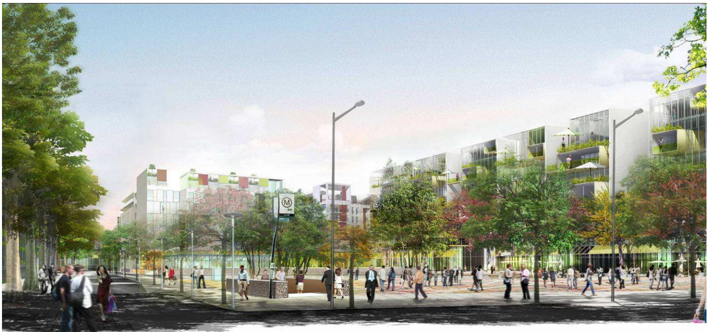
La place du Front Populaire – Porte Sud Campus Condorcet

► Nouveau pôle européen de recherche et de formation à la recherche en sciences humaines et sociales, le Campus Condorcet réunit neuf partenaires de forte notoriété internationale.