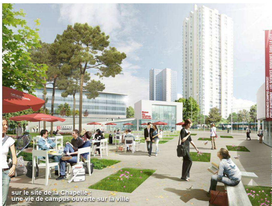
Une vie de Campus ouverte sur la ville – Site de la Chapelle

► En étroite liaison avec les collectivités territoriales et leurs projets d'aménagement, les établissements et la Fondation Campus Condorcet élaborent le concept d'un nouveau campus urbain: un lieu ouvert sur la cité qui accompagne son développement, et qui offre aux étudiants et aux chercheurs un ensemble complet de services.