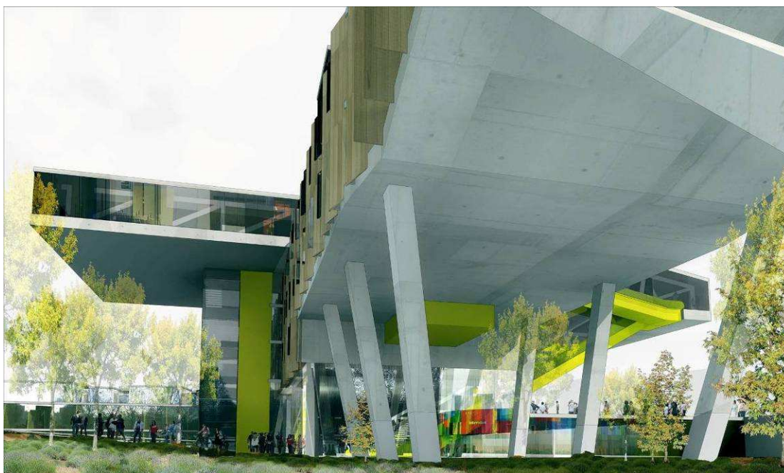
Maison des Sciences de l'Homme – Porte Nord du Campus Condorcet

► Une bibliothèque du 21 e siècle, un centre de conférences international, une maison des chercheurs étrangers, un investissement massif dans les services numériques concourent à la définition d'un équipement scientifique d'excellence. Une maison des initiatives étudiantes, des installations sportives, une offre diversifiée en matière de restauration, de logement et de commerces, et enfin une ouverture sur de très larges plages horaires contribueront à l'animation permanente du campus.