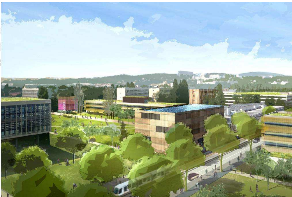
Perspective de la partie Ouest – Campus LyonTech-La Doua

► Par sa réhabilitation et son aménagement, LyonTech-la Doua deviendra un éco-campus exemplaire et expérimental.