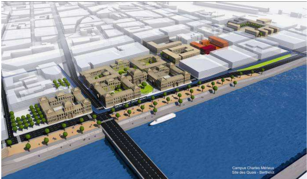
Site des Quais-Berthelot – Campus Charles Mérieux

► Le campus Charles Mérieux regroupe trois pôles universitaires. Il relie le site historique Quais du Rhône-Berthelot au CHU de Lyon Sud via le quartier de Gerland. Il rassemble des établissements publics et privés et des centres de recherche autour des biosciences et des sciences humaines et sociales .