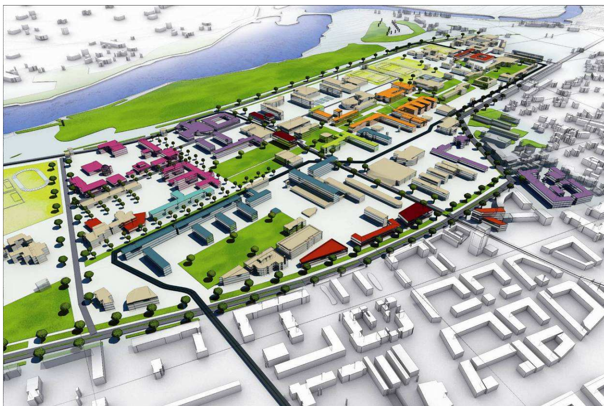
Maquette virtuelle du Campus LyonTech–La Doua

Par ailleurs, pour traiter des enjeux de vie étudiante, un atelier « vie étudiante » va être mis en place, associant représentants étudiants, services jeunesse ou vie universitaire des collectivités, CROUS, bailleurs, etc., va être mis en place à l'échelle de l'agglomération.