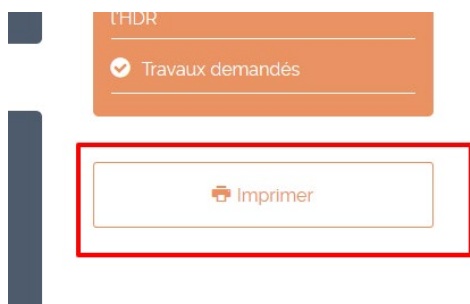
Figure 11 : imprimer son dossier