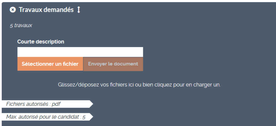
Figure 8 : formulaire de chargement de documents

Les documents envoyés ne doivent pas dépasser 10Mo par fichier, et le format devra de préférence être du PDF.