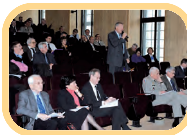
Réunion nationale des trinômes académiques à l'IHEDN, janvier 2009