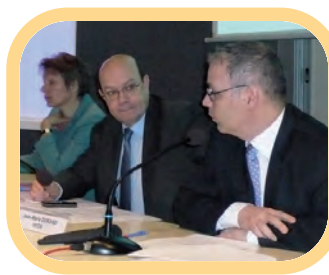
Séminaire de sensibilisation à la sécurité des systèmes d'information à destination de l'encadrement supérieur de l'administration centrale du MEN et du MESR