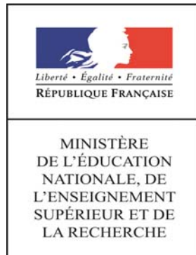
Table des disciplines ou sections du Conseil national des universités